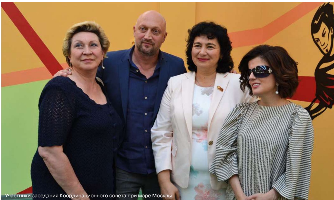
Участники заседания Координационного совета при мэре Москвы

В МОСКВЕ НА СЕГОДНЯШНИЙ ДЕНЬ ПРОЖИВАЕТ 1,03 МИЛЛИОНА ИНВАЛИДОВ, ИЗ КОТОРЫХ 39,9 ТЫСЯЧИ ДЕТЕЙ, ИМЕЮЩИХ ИНВАЛИДНОСТЬ.