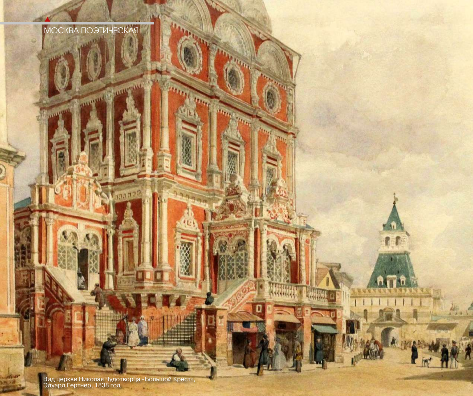
Вид церкви Николая Чудотворца «Большой Крест», Эдуард Гертнер, 1838 год