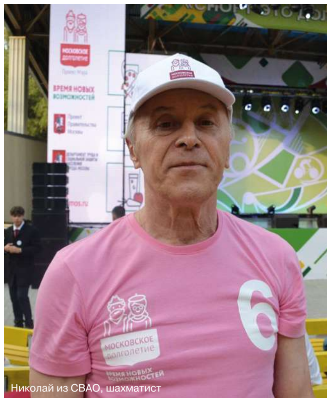
Николай из СВАО, шахматист

— Спасибо правительству города за наше «Московское долголетие». Мои ровесники только сейчас начинают включаться, понимать, что проект нам дан не на один день. И вот они уже выбирают — танцы, йога, скандинавская ходьба. Я так рада, что живу в это время, потому что каждый день у нас происходит что-то новое. И пусть это продолжается!